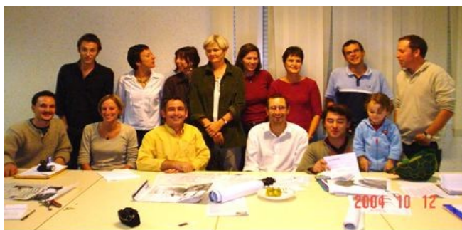
Réunion du mois d'octobre.